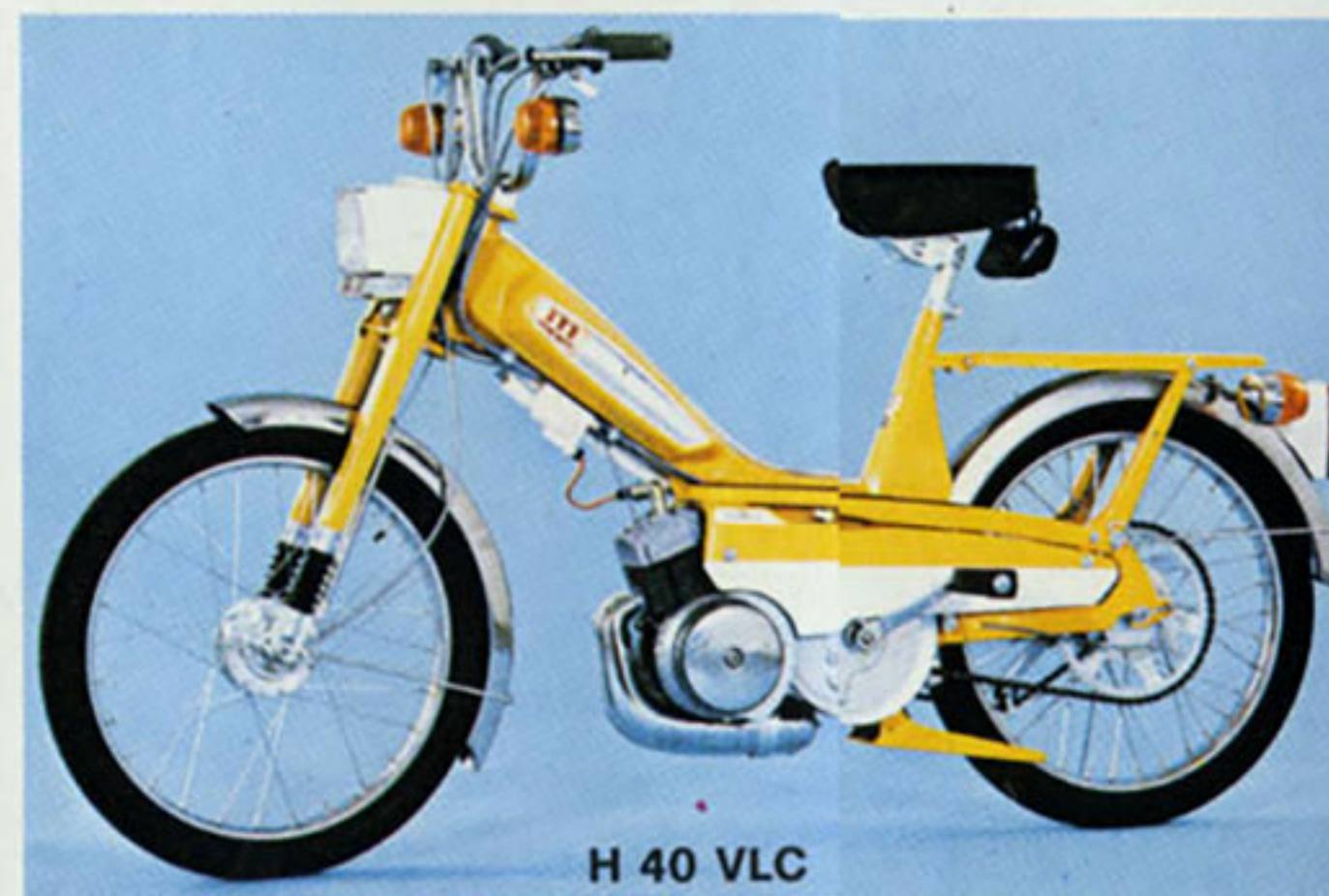
H 40 VLC