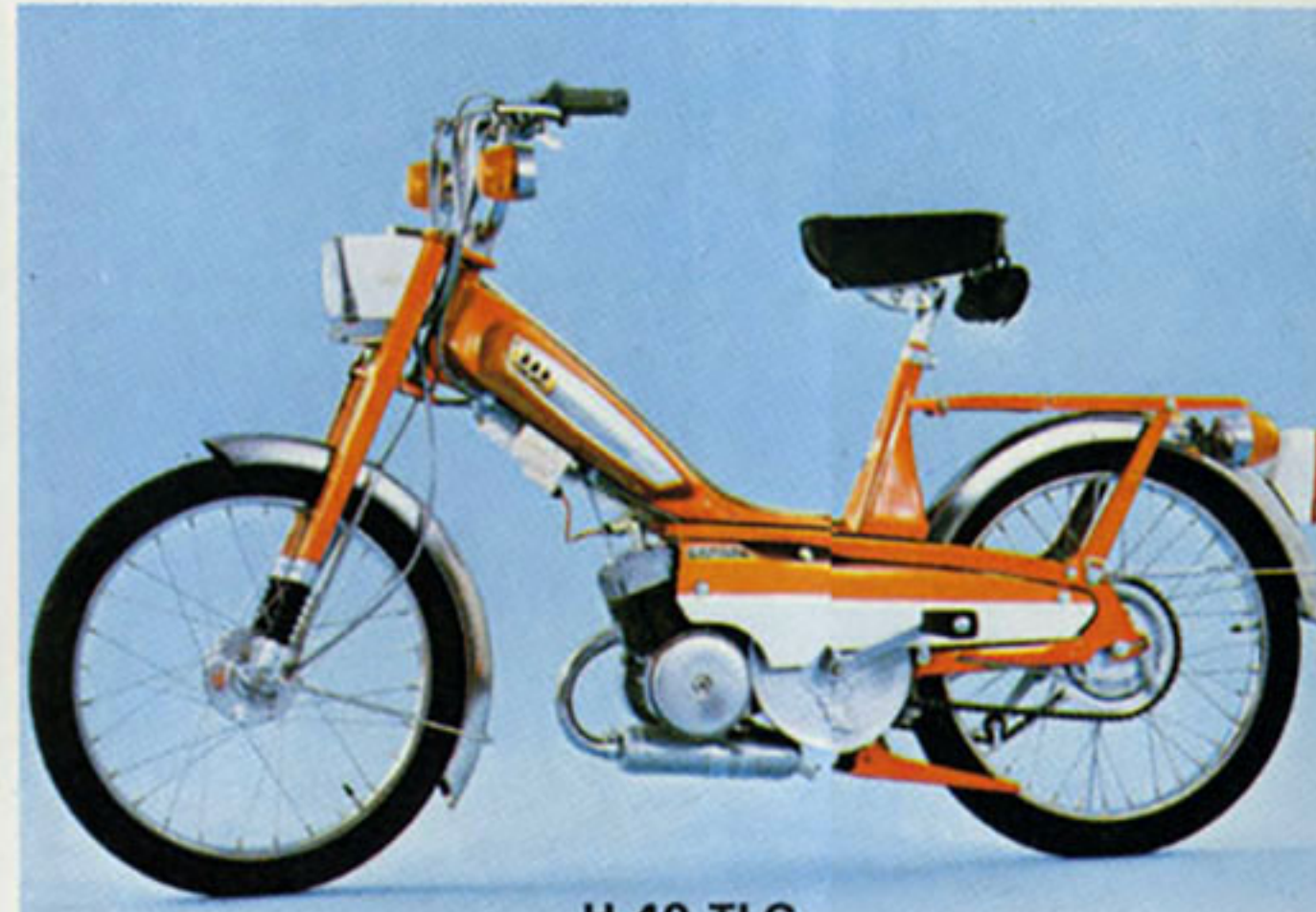
H 40 TLC

Couleurs : orange ou jaune - Garde-boue AV et AR en acier inoxydable - Phare avec avertisseur électrique et compteur incorporés. Clignotants AV, AR et feu stop fonctionnant sur volant magnétique - Antivol.