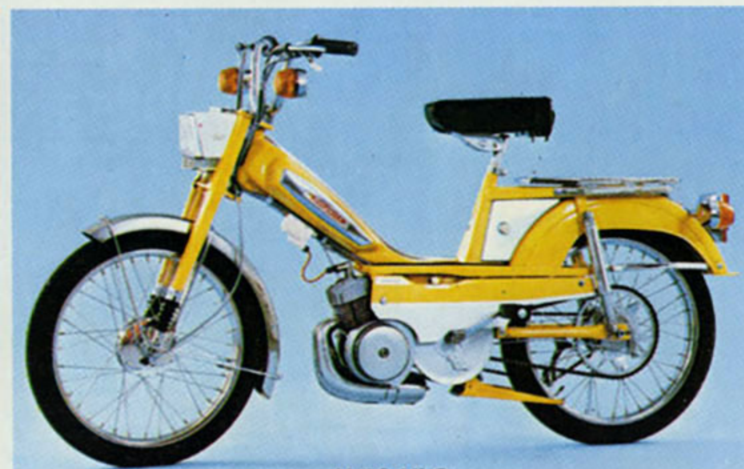
H 50 VLC