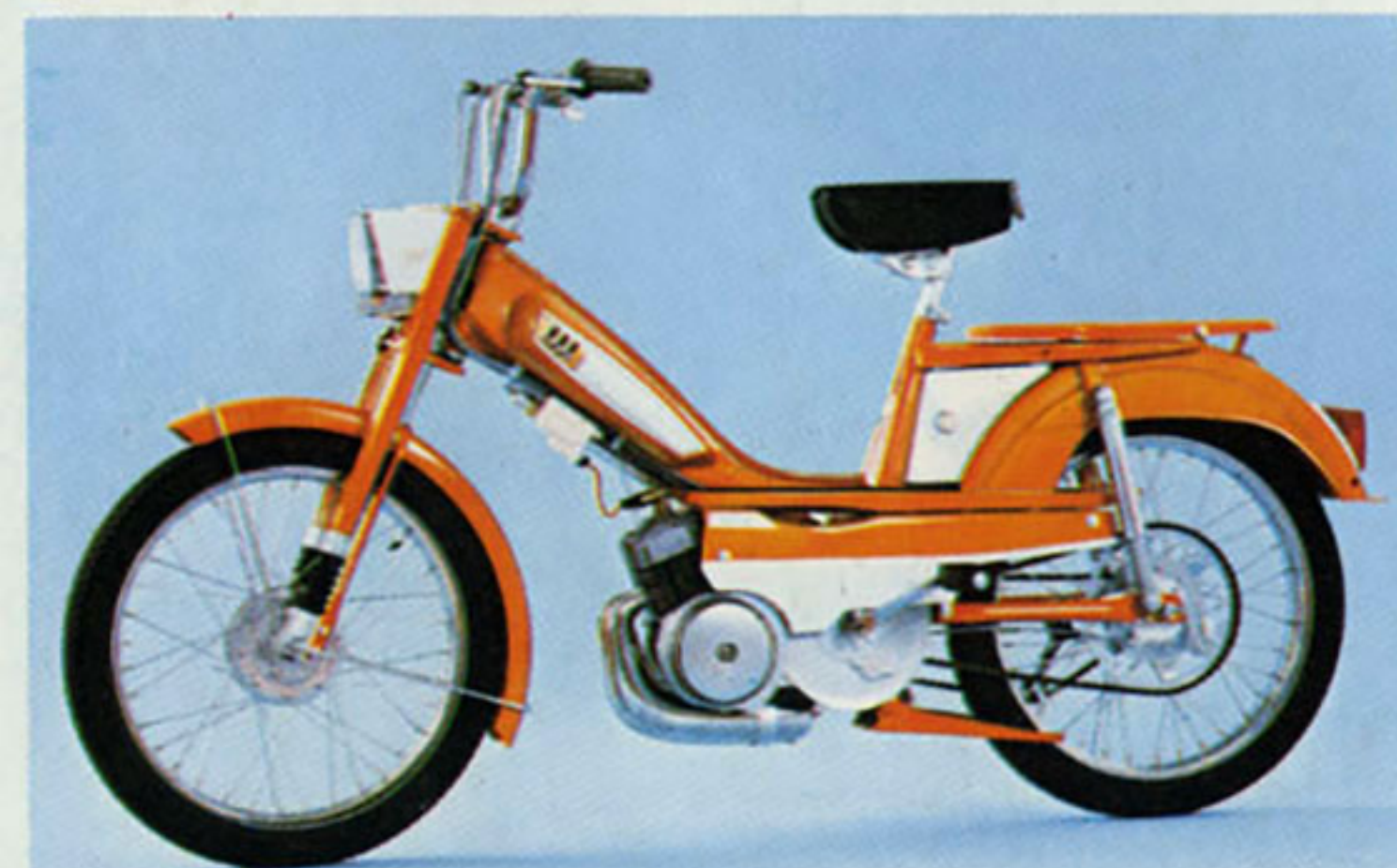
H 50 V Standard

Votre meilleur choix : Une Mobylette 50 VLC à clignotants, feu stop, et Mobymatic.