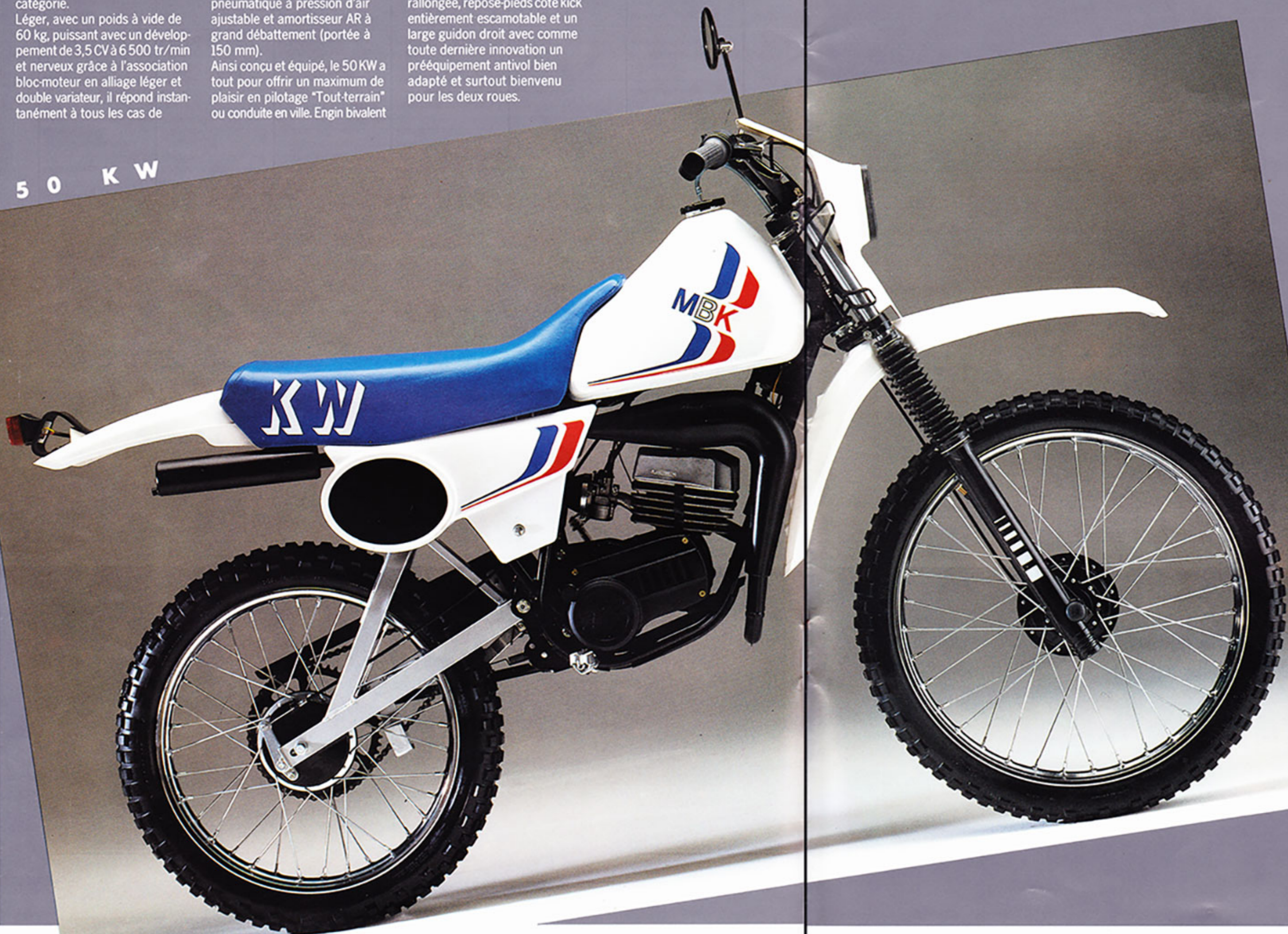
SUSPENSION 50 KW. Mono-amortisseur à gaz, montage en cantilever. Structure AR oscillante en profils rectangulaires.